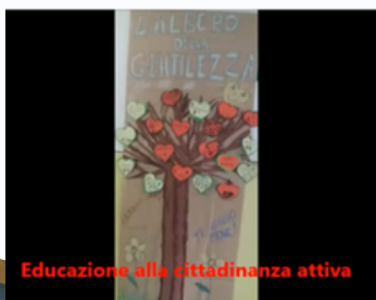
Educazione alla cittadinanza attiva