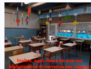
Inoltre, ogni classe ha una sua bibliotechina di narrativa per ragazzi.

Favoriamo l'apprendimento attivo, stimolando il dubbio, la curiosità in modo che ogni bambino provi la gioia e la soddisfazione di imparare