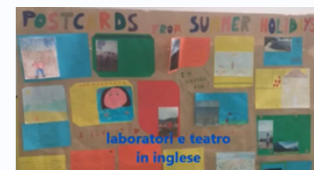
laboratori e teatro in inglese